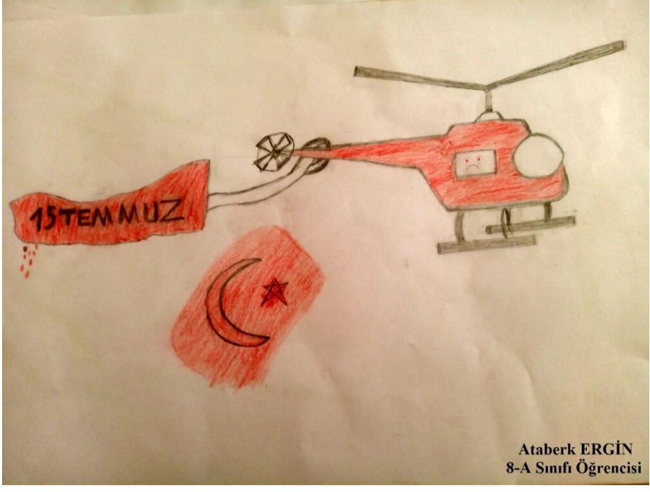
Ataberk ERGİN 8-A Sınıfı Öğrencisi