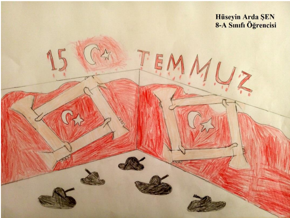
Hüseyin Arda ŞEN 8-A Sınıfı Öğrencisi